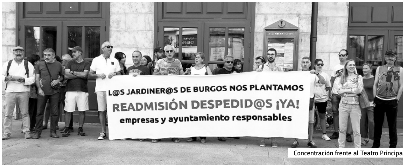
Concentración frente al Teatro Principal

Tras cerca de cuatro meses las personas trabajadoras de la contrata de Jardinería del Ayuntamiento de Burgos siguen sin cobrar la liquidación por la finalización de la anterior concesionaria, Construcciones Arranz Acinas - Grupo Raga , y sin ser readmitidas por la nueva