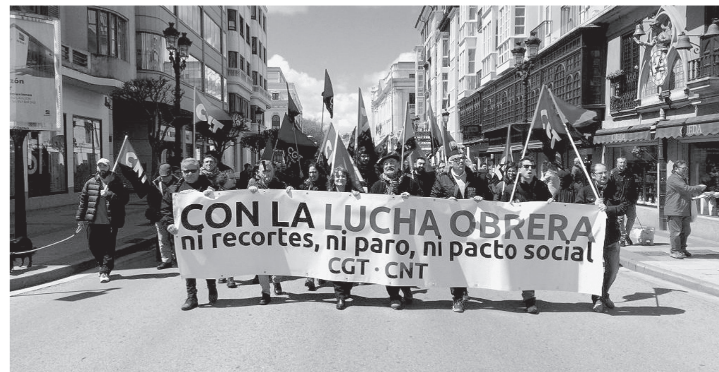
Manifestación del 1º de Mayo de 2018 en Burgos.

Los tiempos no cambian. La explotación laboral sigue vigente. Las libertades públicas se ven amenazadas con el auge de ideologías totalitarias y con las leyes regresivas de los últimos gobiernos. La mitad de la población sigue marginada y sufriendo la intolerable lacra de la violencia machista. Se niega la existencia del cambio climático y se propicia por los mercados la sobreexplotación del planeta. No, los tiempos no han cambiado tanto.