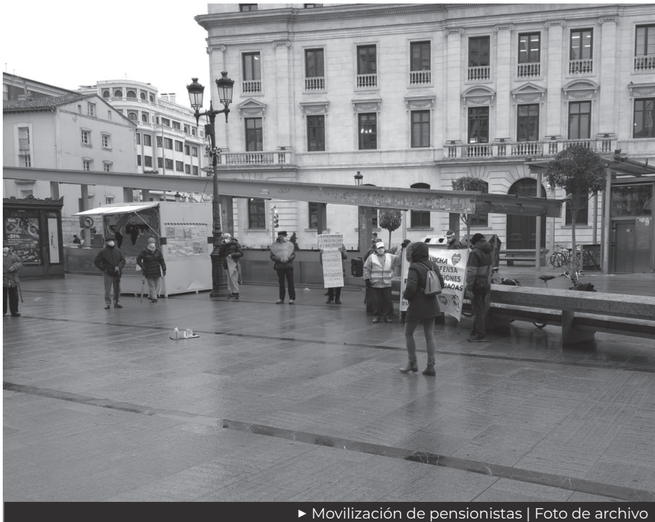
► Movilización de pensionistas

Jornada de movilización contra las recomendaciones del Pacto de Toledo, el pacto social que puede modificar la situación del Sistema Público de Pensiones, contra la privatización a través de los planes privados de pensiones a través de la negociación colectiva, y en demanda de la auditoría de las cuentas de la Seguridad Social.