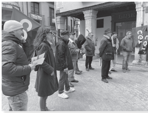
ARANDA DE DUERO