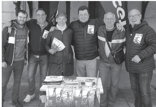
MIRANDA DE EBRO